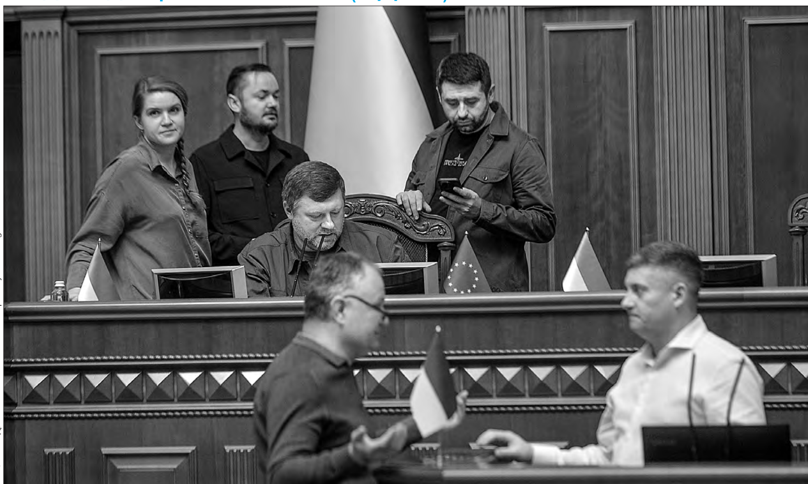
Більше фото тут — www.golos.com.ua